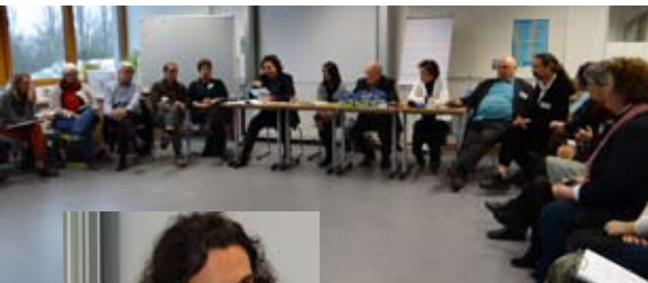
◀ Schulleitungstagung, 4.3.16