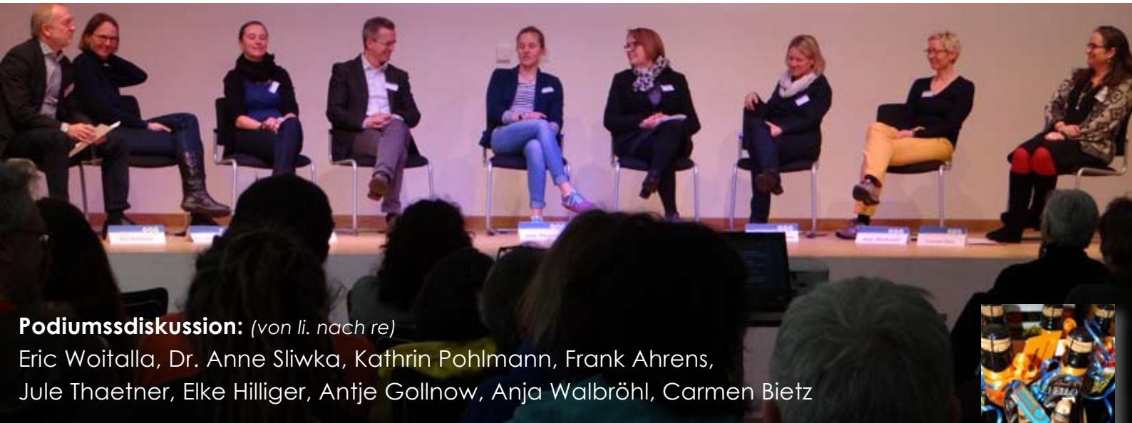
Podiumsdiskussion: (von li. nach re)