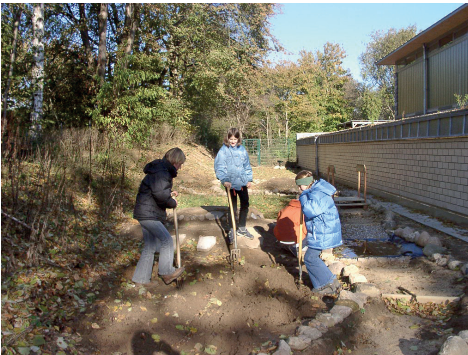
Die Beschaffenheit des Bodens wird untersucht