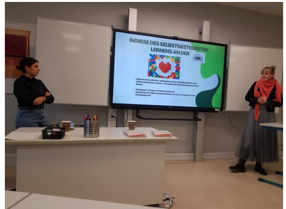
Foto aus dem Workshop Selbstständiges Lernen und individuelles Feedback mit Lernlog

Denn es ist lt. Frau von Ilsemann „Zeit, den Weg zum Abitur neu zu gestalten“ – sogar allerhöchste Zeit!